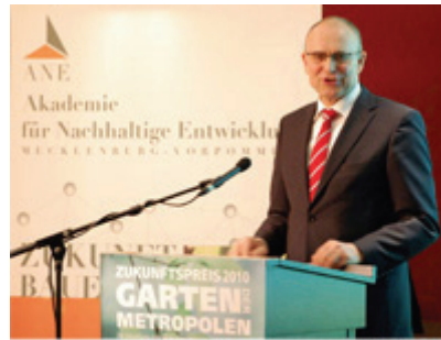
Ministerpräsident Erwin Sellering

Der Zukunftspreis sei hierfür eine gute Motivation. Außerdem würdigte der Ministerpräsident den Einsatz der ANE und das Engagement der Stifter: „Die Akademie leistet sehr engagierte Arbeit und hat sich vor allem mit einem Projekt hervor getan: Sie unterstützt Kommunen dabei, zu sogenannten Bioenergiedörfern zu werden. Das heißt, dass sich diese Dörfer selbst mit Energie versorgen, und zwar auf der Basis erneuerbarer Energieträger. Gerade vor dem Hintergrund der demografischen Entwicklung in unserem Land ist aber klar: Wir brauchen noch mehr solcher konkreten Projekte. Deshalb ist es gut, dass die Akademie für Nachhaltige Entwicklung diesen Zukunftspreis ausgelobt hat. Denn hier wird vielleicht das nächste Erfolgsprojekt entdeckt und zur Serienreife entwickelt.“