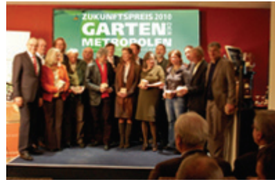
Preisträger & Teilnehmer des Zukunftspreises 2010 in Anwesenheit des Ministerpräsidenten Erwin Sellering

Im Rahmen einer inspirierenden Preisverleihung ist der Zukunftspreis 2010 – Garten der Metropolen am 02. Dezember 2010 in Schwerin durch den Ministerpräsidenten Mecklenburg-Vorpommerns Erwin Sellering verliehen worden. Die Spannweite der eingereichten Projekte und der enthaltenen Ideen boten der Jury eine Menge Stoff für intensive Diskussionen und führten zu einer Aufteilung des Zukunftspreises in einen Kommunikationspreis, einen Umsetzungspreis und zwei Anerkennungspreise.